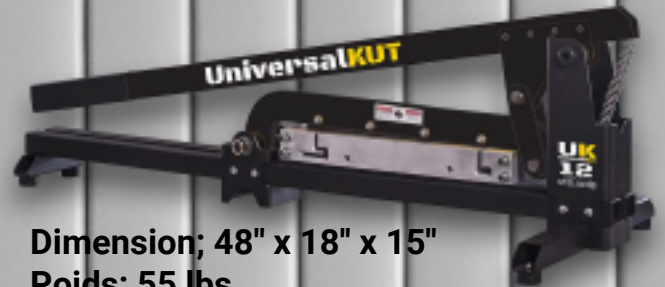
Dimension; 48" x 18" x 15" Poids: 55 lbs