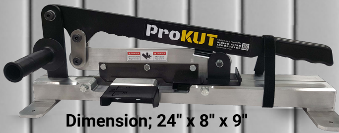
Dimension; 24" x 8" x 9" Poids: 18 lbs